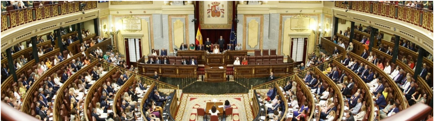
Plano general del hemiciclo del Congreso.

Estos sistemas permiten, incluso, escuchar la traducción con la misma voz y forma de hablar de quien está formulando el discurso