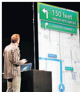
Los mapas de Apple

■ Aunque ahora algunos críticos opinan que Jobs estaría cabreado con el lanzamiento de productos que no están bien acabados, como la nueva aplicación Mapas, Dans recuerda que el fundador de Apple “tam-