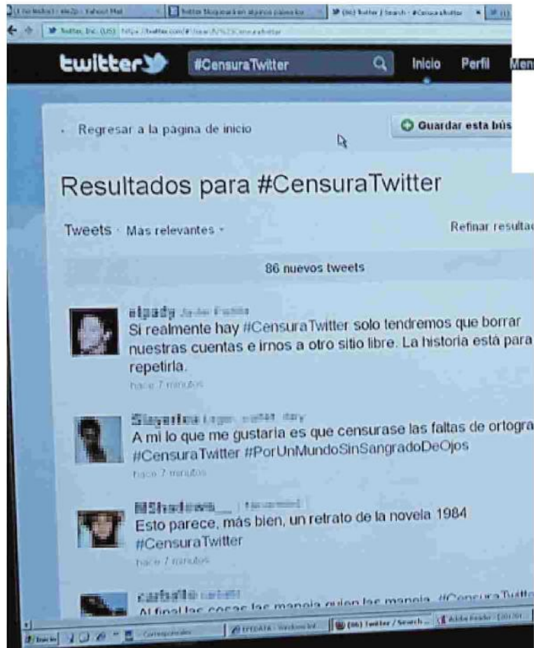
La etiqueta #censuraTwitter simbolizó la queja de los usuarios

¿Twitter censura? No todos están de acuerdo con la acusación. «Creo que es una interpretación exagerada o tergiversada. Lo que dice el comunicado es que cuando la legislación de un país les obliga a retirar un comenta-