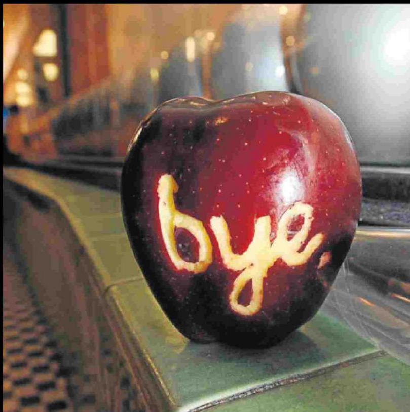
Una manzana con la palabra 'bye' en una tienda de Apple simboliza la despedida a Jobs.

No es la primera vez que Apple pierde a uno de sus creadores, pero en esta ocasión es una pérdida definitiva. La gestión realizada tras la primera salida de Jobs, en 1985, puso a la empresa entre la espada y la pared y Steve tuvo que volver 12 años después como salvador, para rescatar a Apple de una quiebra inminente. Pero esta vez —dicen los expertos— es muy diferente. Jobs preparó a su compañía para afrontar el largo plazo: reunió a la cúpula directiva en torno a su sucesor, Tim Cook, y creó una cultura de producto basada en innovaciones, diseño y facilidad. La empresa funciona como si fuera una máquina eficiente que crea sin esfuerzo apa-