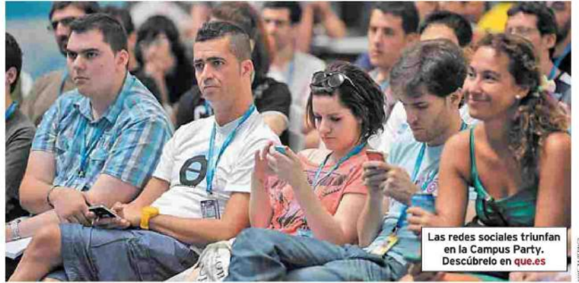
Las redes sociales triunfan en la Campus Party. Descúbrelo en que.es