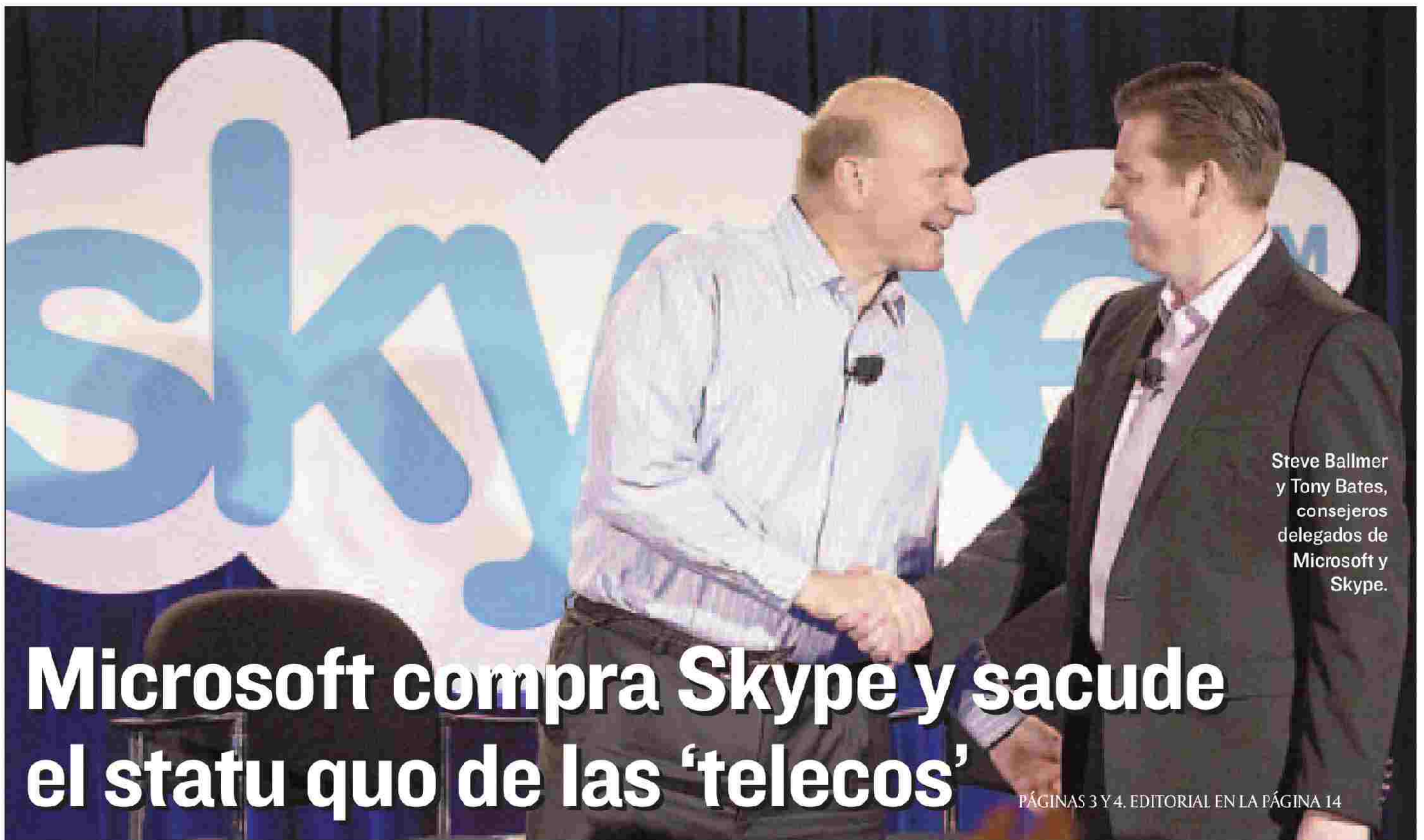
Steve Ballmer y Tony Bates, consejeros delegados de Microsoft y Skype.

PÁGINAS 3 Y 4. EDITORIAL EN LA PÁGINA 14