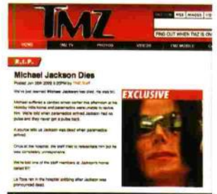
Fueron los primeros en publicar, el 25 de junio de 2009, la muerte del rey del pop.

El blog que anunció la muerte de Michael Jackson 16 minutos después de que sucediera no puede estar equivocado. Veinte periodistas y paparazzi actualizan esta bitácora con 4 millones de lectores mensuales y