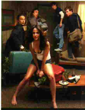
"Weeds", una de las series favoritas del blog Spoiler, finaliza en verano de 2011.

"Tras 'Mad Men', el cine se queda tan pequeñito, con sus 100 minutos, sus efectos especiales, sus palomitas... que no hay con qué comparar". Eso dice Hernán Casciari, el argentino que desde