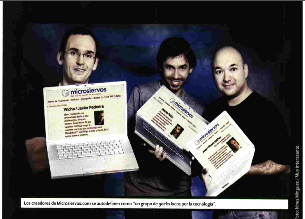
Los creadores de Microservos.com se autodefinen como "un grupo de geeks locos por la tecnología".

"Despiertan a Walt Disney para preguntarle una cosa". "Un argentino muere ahogado en su propio ego". "Una discusión sobre Dostoiévski enfrenta a dos bandas de Latin Kings". Te gustará... Si tú también hubieses dado por bueno el titular "Telecinco emite por error ocho segundos de un documental". Este blog español de noticias falsas ha logrado colársela a muchos medios 'serios'.