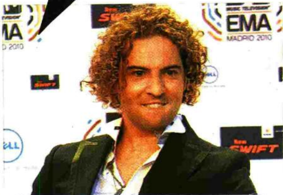
David Bisbal hizo un comentario pueril sobre la revuelta egipcia.

La plataforma, valorada en unos 3.000 millones de euros, dista todavía de los 500 millones de suscriptores que tiene Facebook, pero los expertos auguran que podría superar a la criatura de Mark Zuckerberg. En España hay dos millones de twitters, una cifra relevante si tenemos en cuenta que fue el país donde más creció Twitter en el 2010.