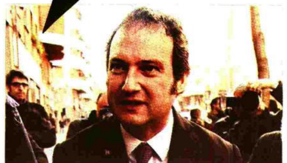
Jordi Hereu busca ser el elegido para concursar en las municipales.

«No tenemos ningún problema en hacer los debates que sean necesarios y en las condiciones que se crean», respondió Hereu en Twitter al reproche de Tura.