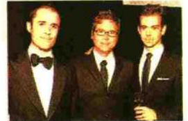
William, Stone y Dorsey.

El día que Jack Dorsey (St. Louis, EEUU, 1976) propuso a la empresa en la que trabajaba en San Francisco una solución para mantener en contacto a sus empleados no imaginaba que estaba alumbrando un sistema de envío de mensajes capaz de poner patas arriba la comunicación entre personas a nivel planetario. Pero Twitter, que nació como una alternativa gratuita al sms, hoy se ha convertido en uno de los principales protagonistas de la revolución que las redes sociales están llevando a cabo en internet.